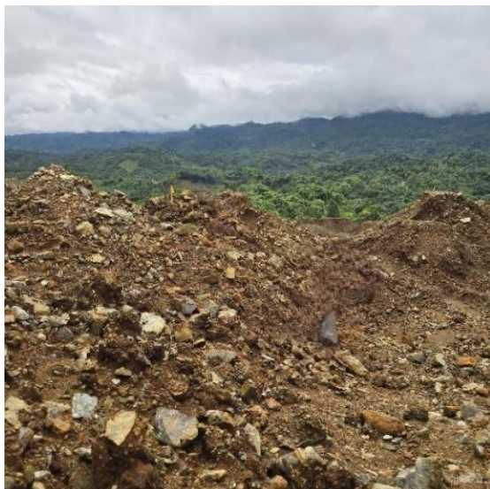
Gambar 2. Lokasi Pengambilan Sampel